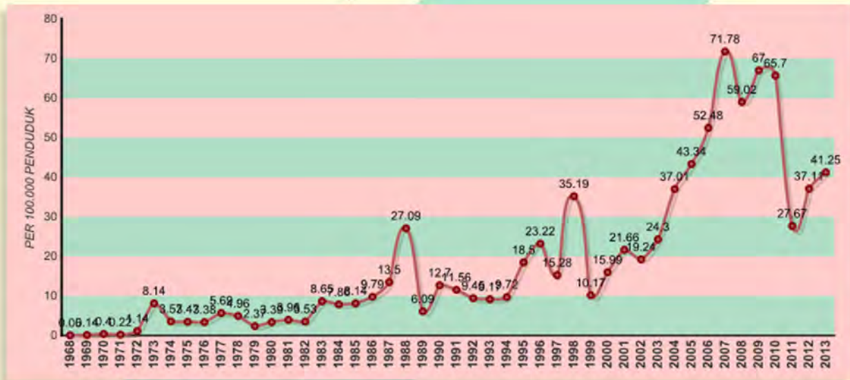
Gambar 1. Angka Kesakitan atau Incidence Rate (IR) DBD per 100.000 Penduduk di Indonesia Tahun 1968 – 2013