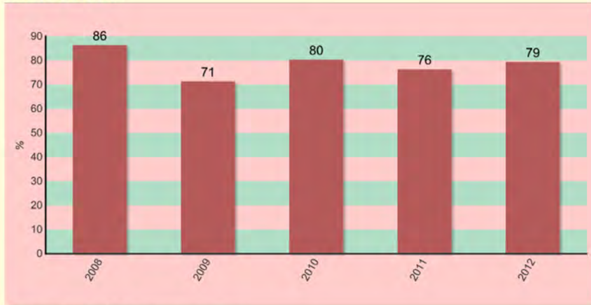
Gambar 5. Angka Bebas Jentik (ABJ) Di Indonesia Tahun 2008-2012

Sumber : Ditjen PP & PL Kemenkes RI, 2012