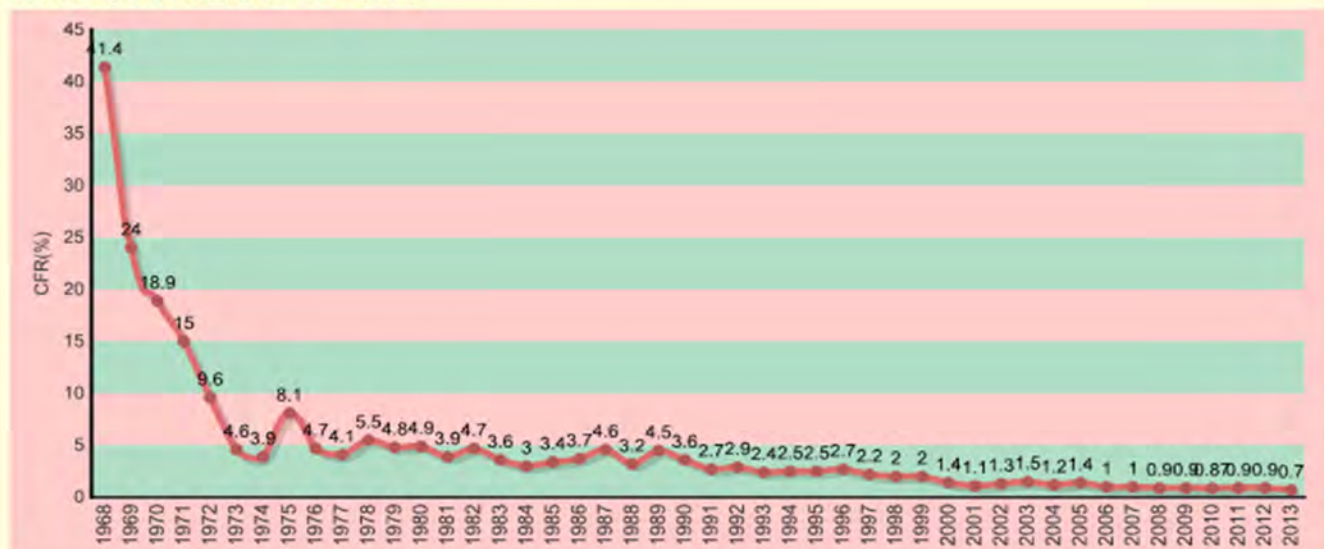
Gambar 3. Laju Kematian atau Case Fatality Rate (CFR) DBD di Indonesia Tahun 1968 – 2013